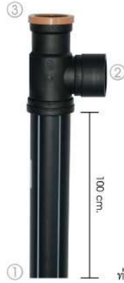
ท่อยาว 100 ซม.