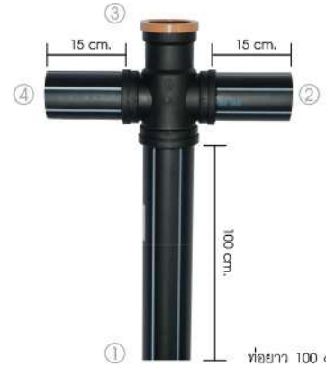
ท่อยาว 100 ซม.