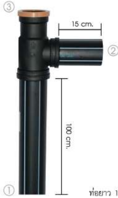
ท่อยาว 100 ซม.