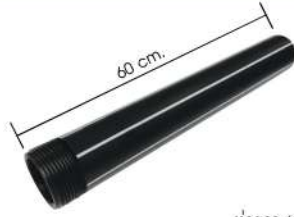
ท่อยาว 60 ซม.