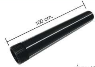
ท่อยาว 100 ซม.