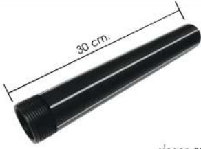
ท่อยาว 30 ซม.