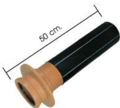
* ความยาวทั้งหมด 50 ซม.