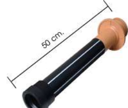
* ความยาวทั้งหมด 50 ซม.