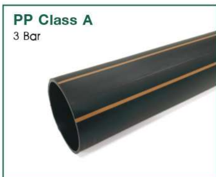
PP Class A 3 Bar

ท่อและข้อต่อ พีพี ตรา พีบีพี สำหรับงานระบบท่อระบายน้ำ