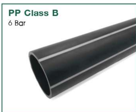
PP Class B 6 Bar