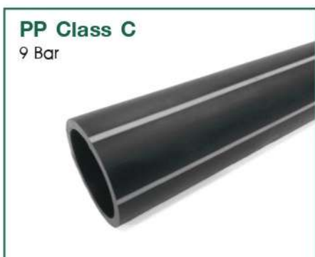
PP Class C 9 Bar